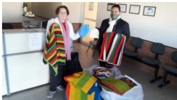
Centro de Amparo aos idosos Jesus, Maria e José. Foram entregues 74 mantas e 30 gorros.