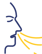
Dificuldade para respirar