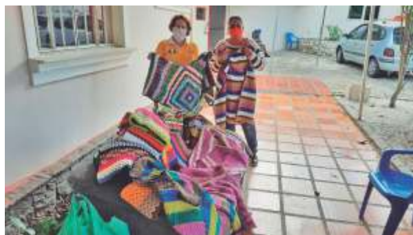
Lar Vovô Joana Entregue 22 mantas elaboradas pelas nossas voluntárias da AFAB.